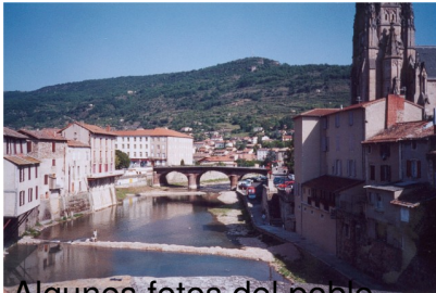
Algunes fotos del poble