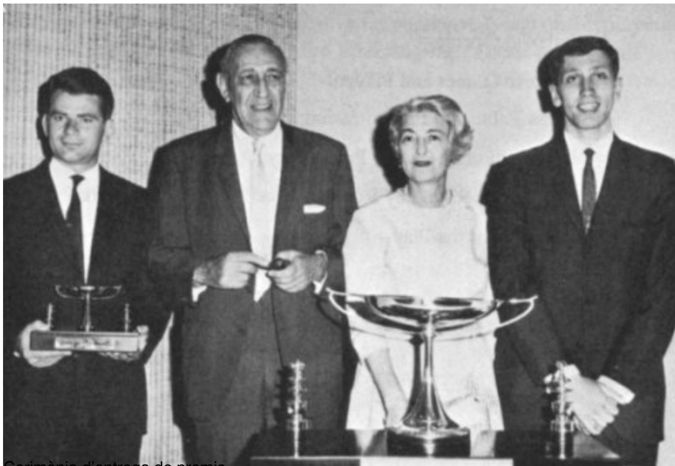
Cerimònia d'entrega de premis