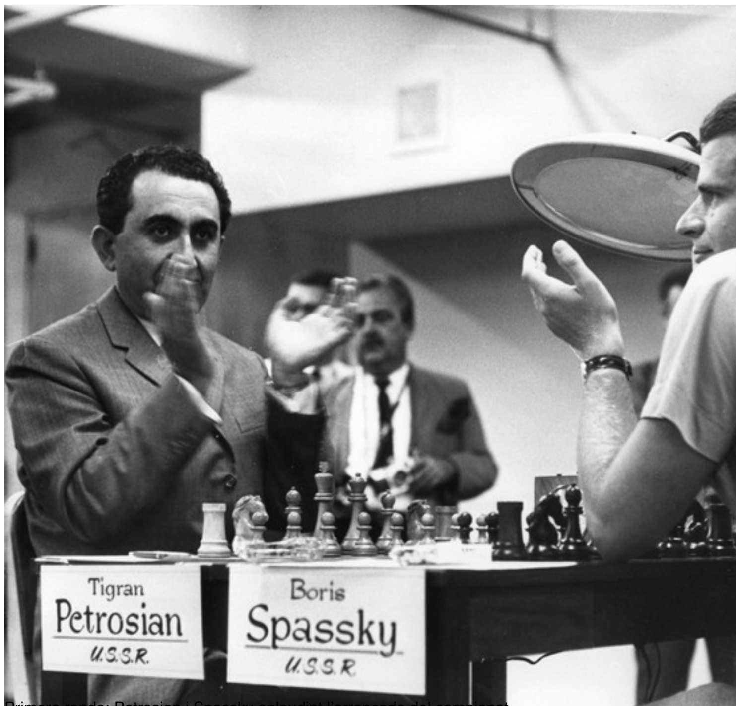
Primera ronda: Petrosian i Spassky aplaudint l'arrancada del campionat