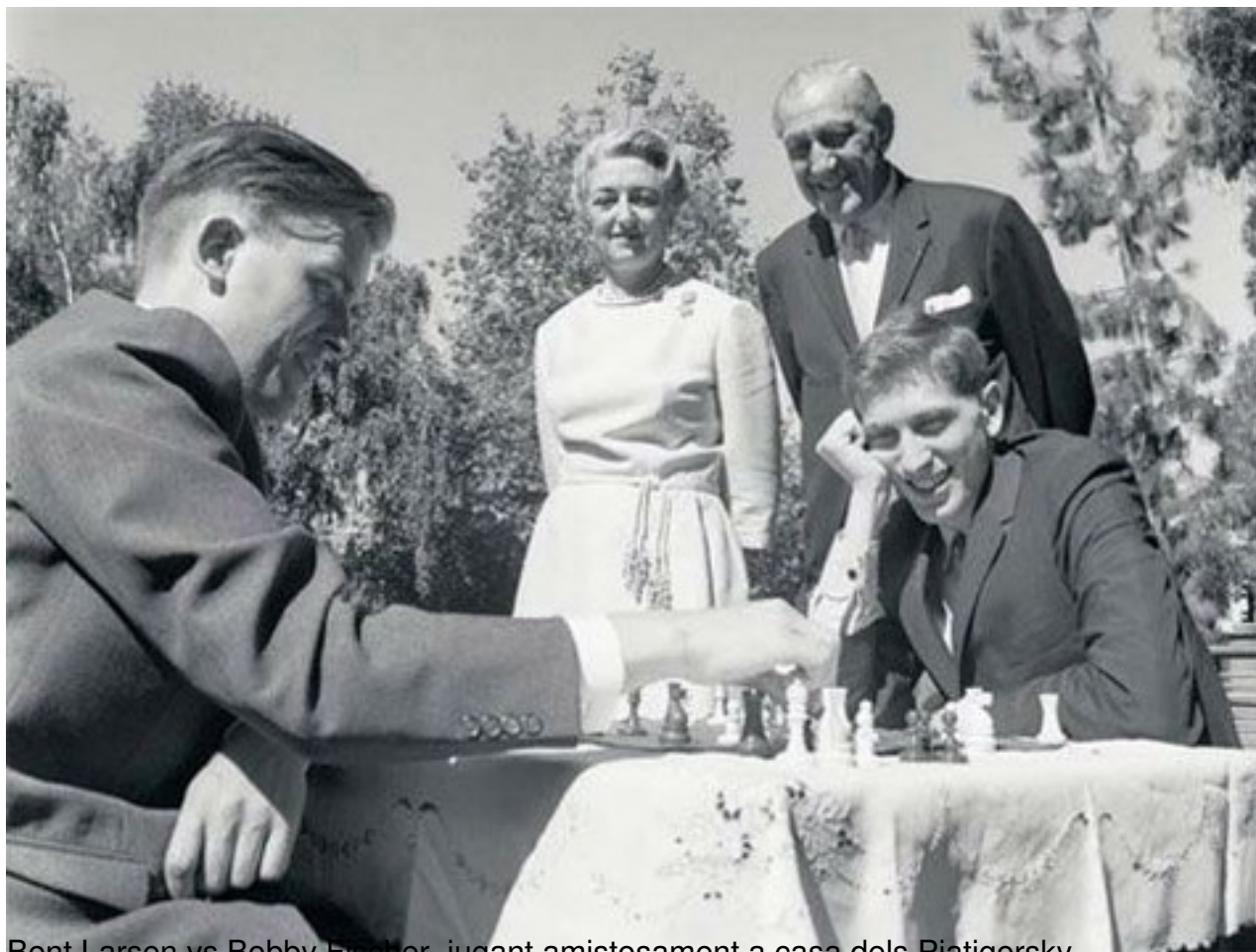
Bent Larsen vs Bobby Fischer, jugant amistosament a casa dels Piatigorsky