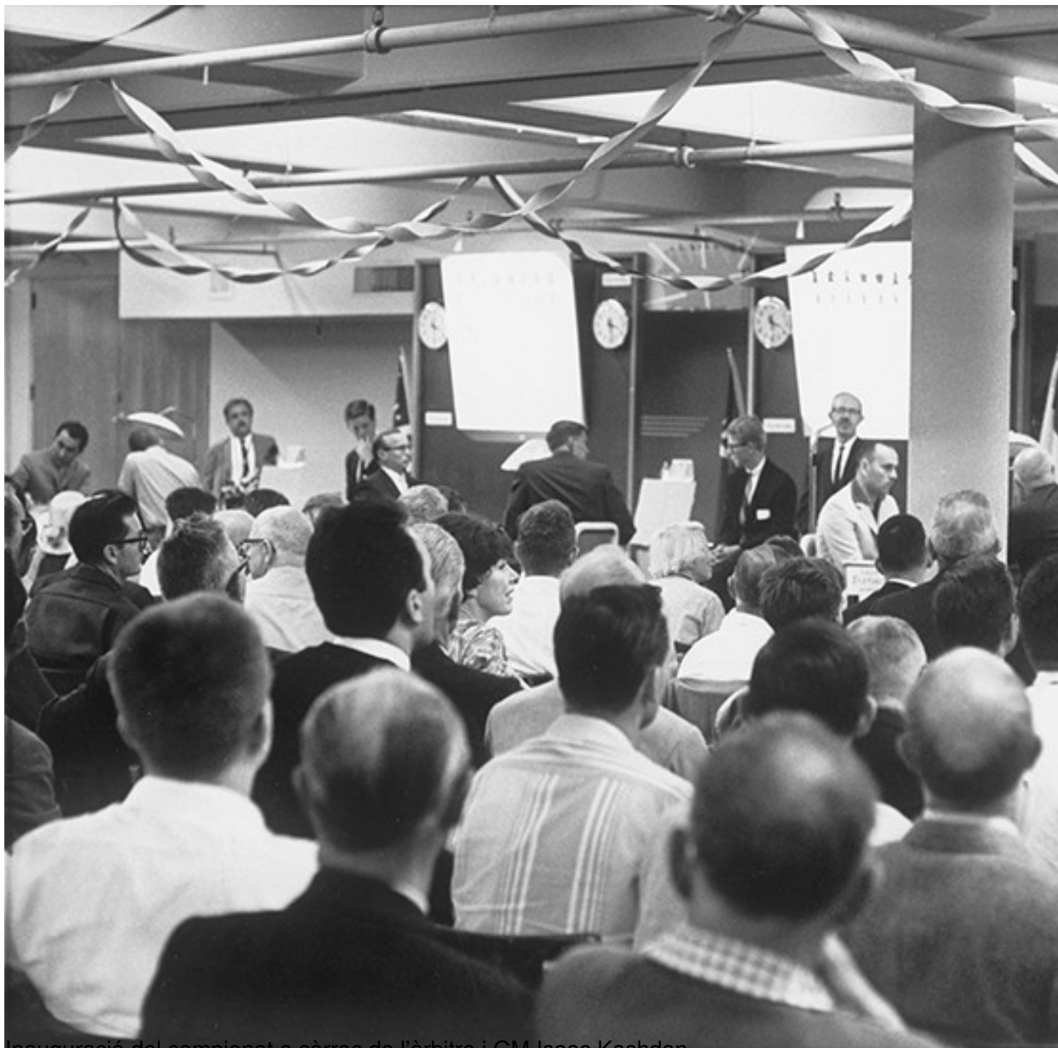
Inauguració del campionat a càrrec de l'àrbitre i GM Isaac Kashdan