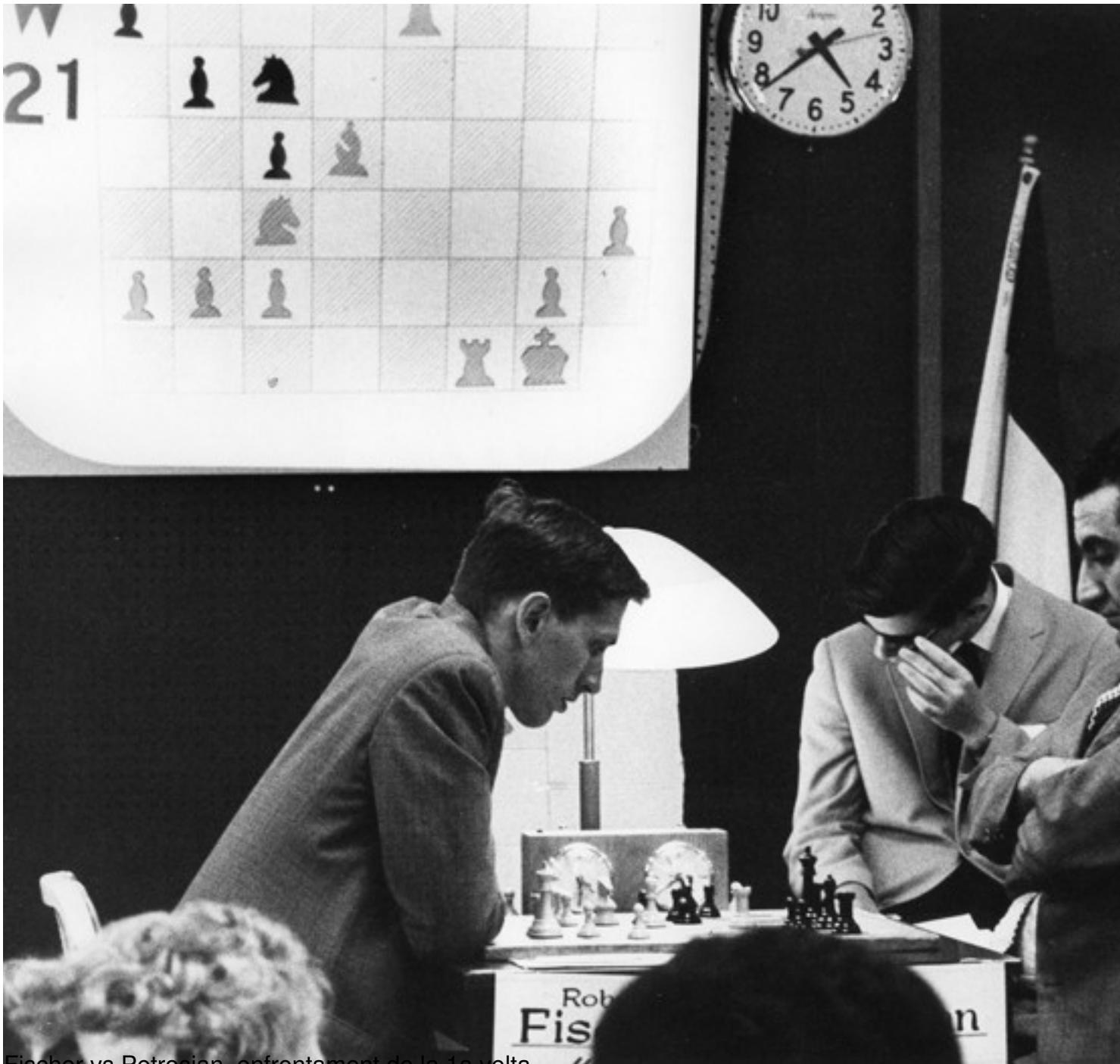
Fischer vs Petrosian, enfrontament de la 1a volta