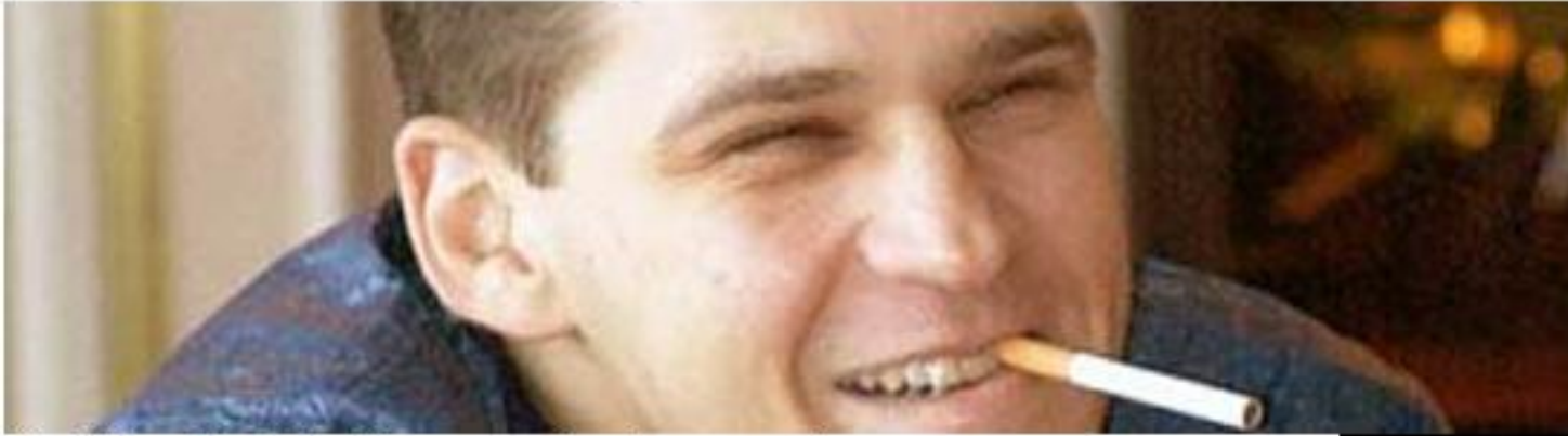
Vladislav Tkachiev