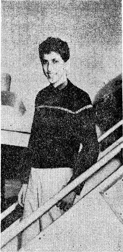
Bobby Fischer, a los quince años, cuando después del Torneo Interzonal de 1958 alcanzó el título de gran maestro

ta. Porque no se trata sólo de que el aspirante sea norteamericano, sino que, a la vista de su estela de triunfos «Bobby» tiene grandes posibilidades de salir vencedor y alzarse con el título.