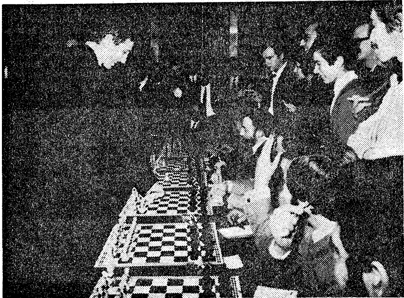
Disponiéndose a iniciar una exhibición de partidas simultáneas, en Madrid, después de ganar el Torneo Interzonal de 1970

encuentros, no sólo el campeón sino, también, los aspirantes han sido de nacionalidad soviética. Por esto la victoria de Fischer en el «Candidatos» de 1971, causó una auténtica convulsión en el ajedrez mundial. Es la primera vez que está en peligro la hegemonía sovié-