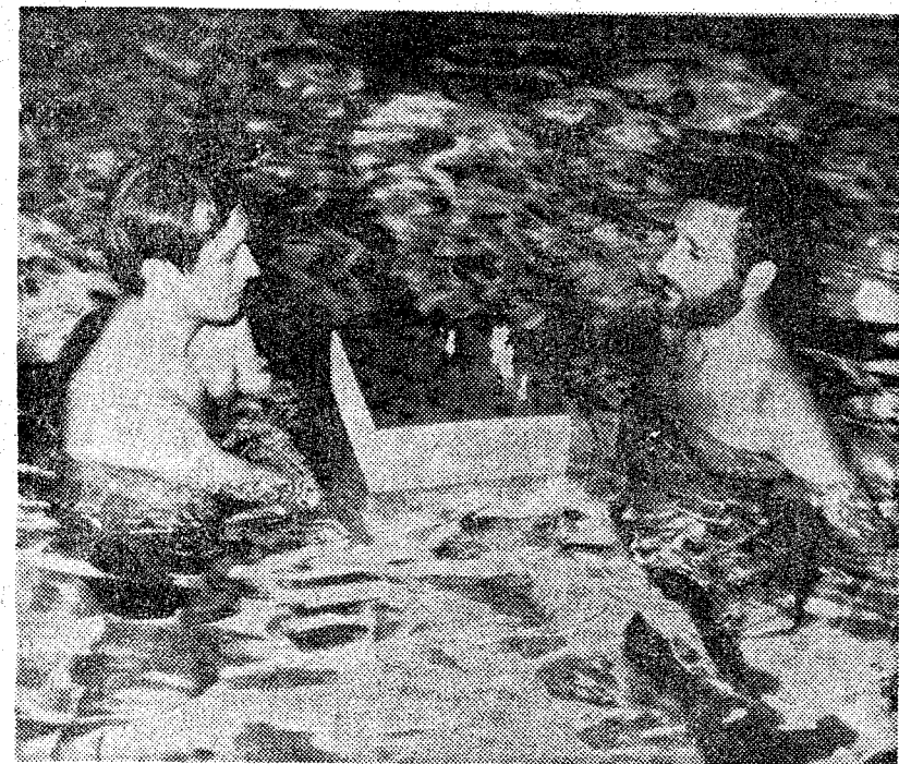
Ajedrez, ajedrez, siempre ajedrez. Aun en la piscina —la natación es uno de sus deportes favoritos—, Fischer «aprovecha» su tiempo. Aquí le vemos con su habitual ayudante, el gran maestro Larry Evans