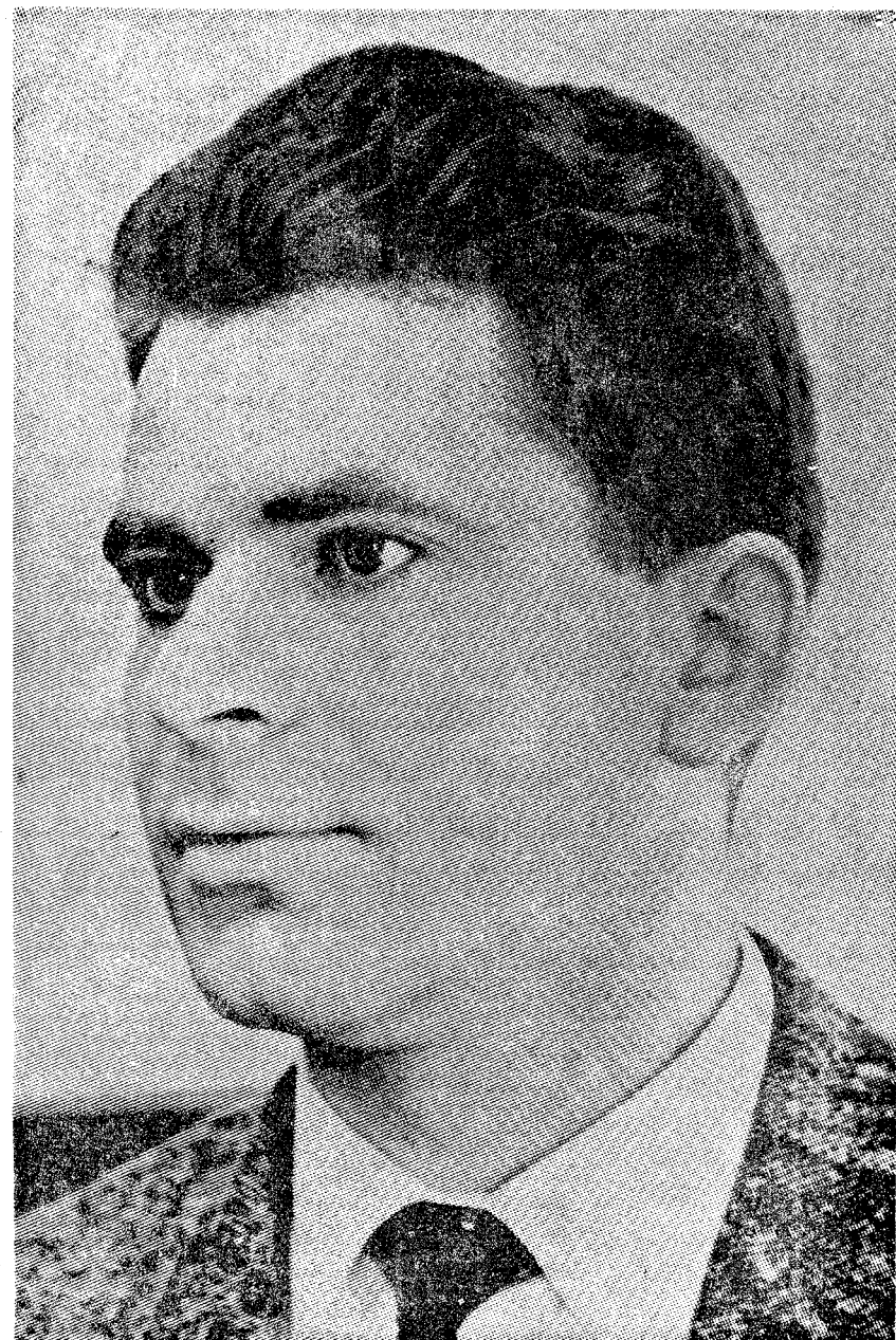
Boris Spassky, campeón mundial

El ex campeón Botvinnik, en cambio, se muestra decididamente en favor de su compatriota: «Visto en conjunto, considero a Spassky más fuerte que Fischer. Spassky es un maestro muy polifacético y un buen psicólogo, y esto lo ha demostrado innumerables veces.» Larsen, batido netamente por Fischer (0-6) en 1971, está también firmemente convencido del triunfo de Spassky: «Boris conoce bien sus medidas». Otro derrotado, Petrosian, ha dicho: «No pue-