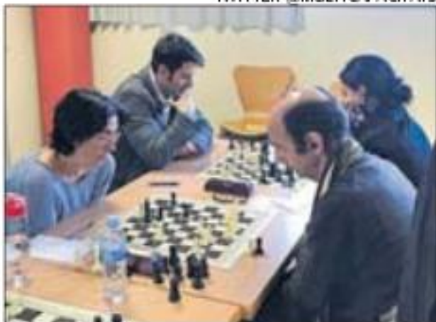
Els quatre jugadors d'escacs.